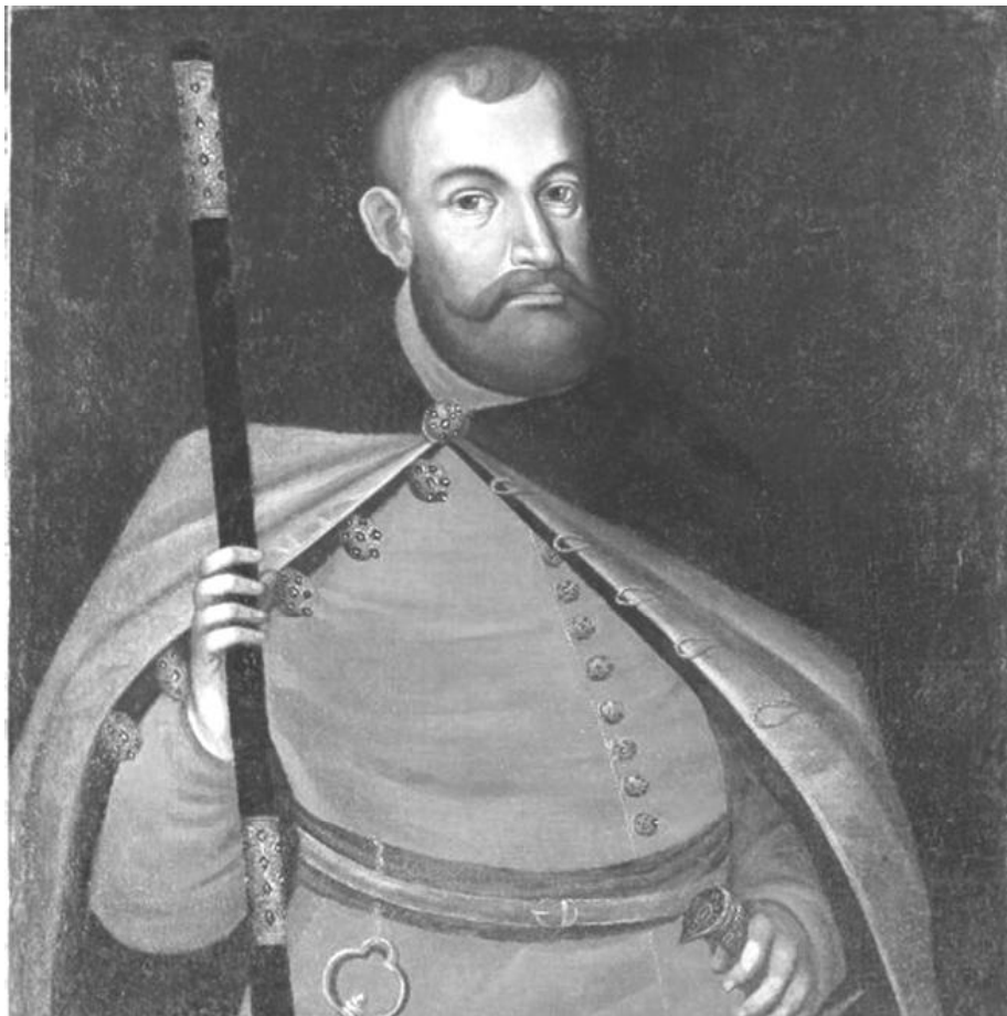
Мал. 2. Ян Станіслаў Сапега

Пасля смерці Я. К. Хадкевіча некалькі гадоў працягваліся спрэчкі за яго спадчыну паміж жонкай Ганнай, братам Аляксандрам і зяцем Янам Станіславам Сапегам, жанатым з адзінай дачкой гетмана Ганнай. Урэшце большая частка маёмасці, у тым ліку дзве галоўныя рэзідэнцыі ў Ляхавічах і Быхаве, адышла зяцю. Кантроль над Быхавам Я. С. Сапега атрымаў не пазней за 1624 г. і ў далейшым прыклаў шмат намаганняў для яго разбудовы. У шматлікай карэспандэнцыі быхаўскіх ураднікаў з магнатам, якая захавалася да нашага часу, можна знайсці многа звестак пра завяршэнне будаўніцтва палаца ў замку і пра ўзвядзенне гарадскіх умацаванняў.