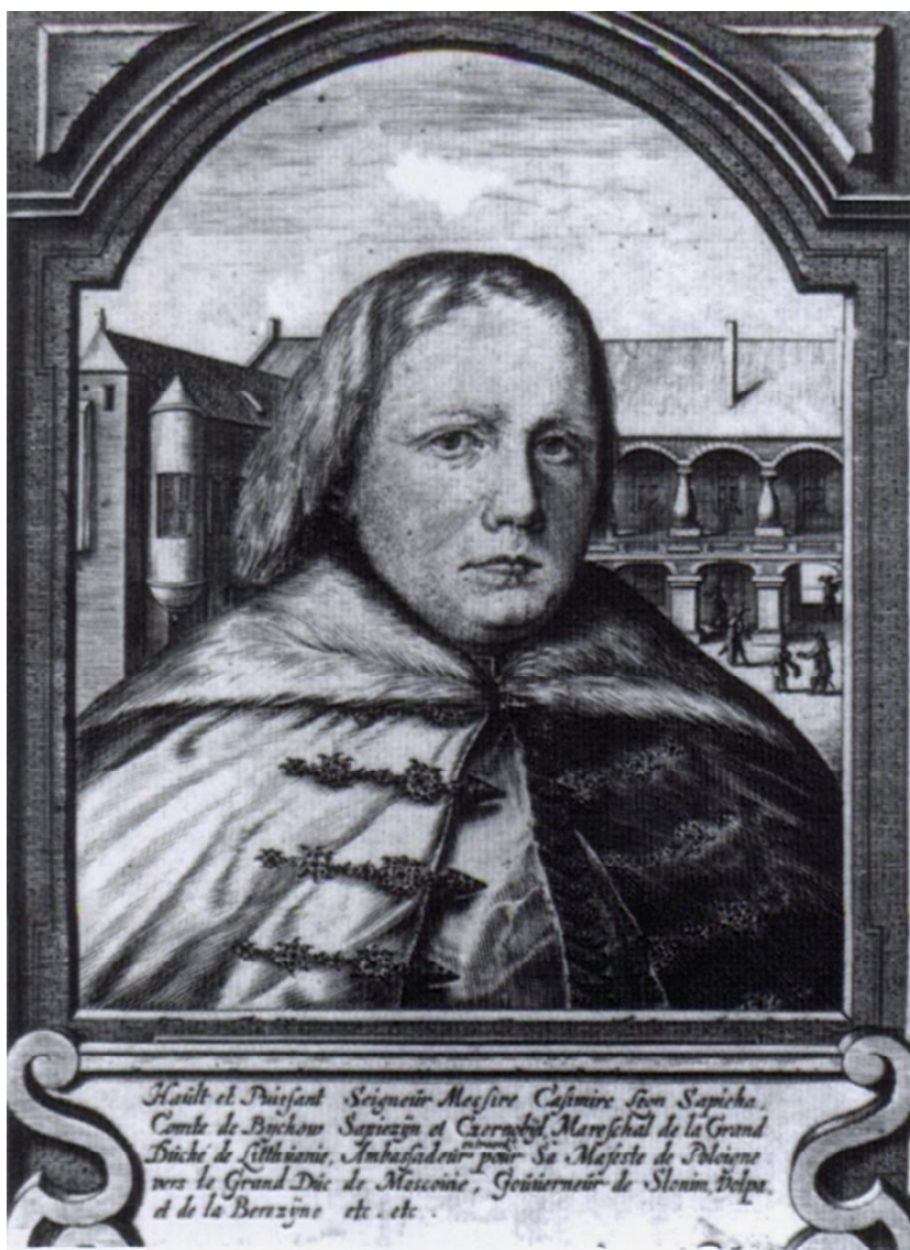
Мал. 3. Казімір Леў Сапегі. Гравюра 1644 г.

2 пакоі, 2 сяней, капліца, якая знаходзілася ў вежы, прыбудаванай з усходняга боку да палаца. Будаўніцтва самой вежы таксама было завершана: у верасні на ёй быў усталяваны абабіты белай бляхай купал з залацістым крыжам на версе. Усе згаданыя пакоі прызначаліся для размяшчэння гаспадара. У іх былі зроблены печы, коміны, падлогі, вокны і дзверы. Апошнія атрымалі каштоўныя замкі, якія вырабляў спецыяльна наняты і прывезены ў Быхаў майстар. Акрамя пакояў для гаспадара, былі таксама скончаны два жылыя памяшканні для слуг на першым паверсе. Усяго за год на розныя патрэбы ў Быхаве, і найперш на будаўніцтва замка, М. Хацімоўскім было выдаткавана 6800 злотых 1 .