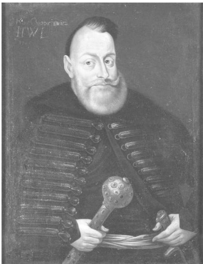
Мал. ... Ян Караль Хадкевіч. Партрэт першай чвэрці XVII ст.

У папярэдняй публікацыі намі была выказана думка, што Я. К. Хадкевіч па шэрагу прычын не мог ініцыяваць маштабнае будаўніцтва ў Быхаве. Па-першае, першапачаткова, будуючы сваю вайсковую кар’еру, ён быў вымушаны выдаткоўваць значныя сродкі на войска (у 1605 г. ён заняў пасаду вялікага літоўскага гетмана) 2 . Па-другое, у 1607–1620 гг. укладваў значныя рэсурсы ў будаўніцтва бастыённага замка ў Ляхавічах 3 . Аднак больш глыбокае вывучэнне крыніц паказала памылковасць гэтага меркавання.